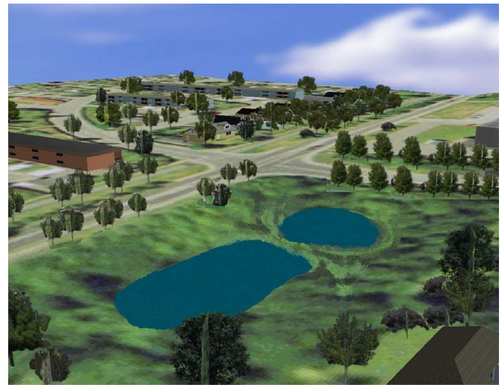
Nyt bassin på Mågebakken – udkast og idé