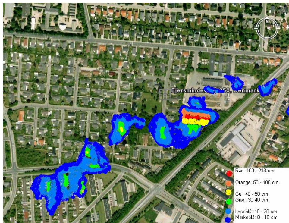
Oversvømmelse for en 10 års regnhændelse