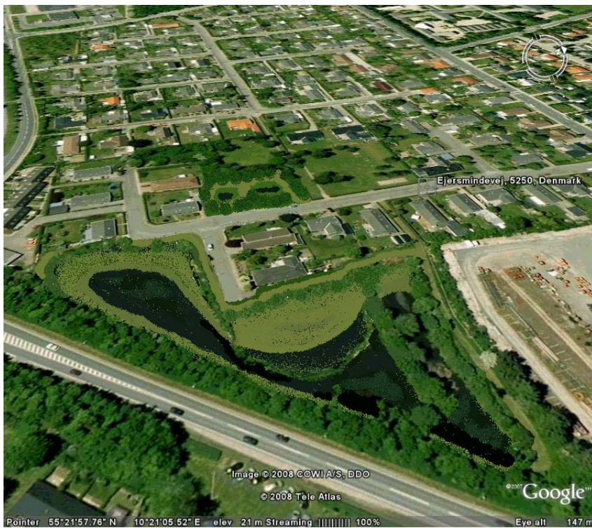
Udvidelse af bassin på Ejersmindevej - udkast

Udvidelsen af bassin ved Ejersmindevej samt nyt bassin på Mågebakken.